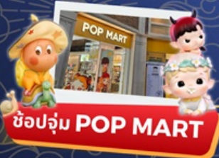
ช้อปจุ่ม POP MART