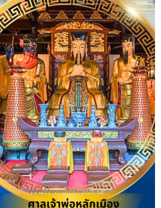
ศาลเจ้าพ่อหลักเมือง