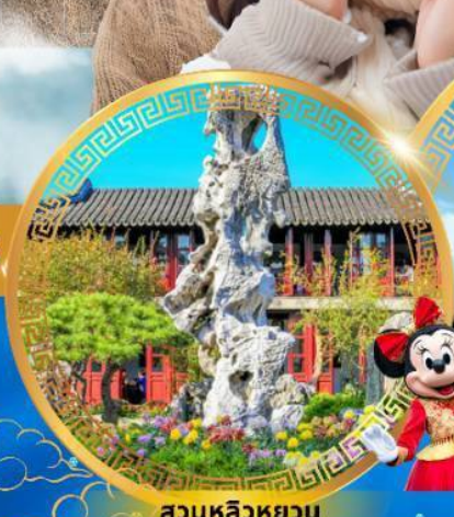
สวนหลิวหยวน