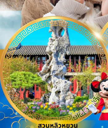
สวนหลิวหยวน