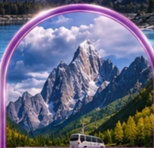
อุทยานสี่ดรุณี (รวมรถอุทยาน)