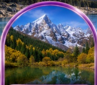
อุทยานปี้ผิงโกว (รวมรถกอล์ฟ)