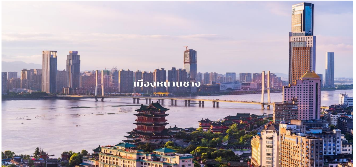
เมืองหนานชาง

นำท่านเดินทางสู่ เมืองหนานชาง เป็นนครหลวงของมณฑลเจียงซี เป็นเมืองสำคัญในสามเหลี่ยมปากแม่น้ำแยงซีเกียง (ใช้เวลาเดินทางประมาณ 3.30 ชม.) หนานชาง เป็นเมืองเอกของมณฑลเจียงซี มีประวัติศาสตร์ยาวนานกว่า 2,200 ปี และด้วยความที่นี่เป็นจุดเริ่มต้นของประวัติศาสตร์การปฏิวัติจีน จึงถูกขนานนามว่าเป็นเมืองวีรบุรุษ ได้รับการยกย่องว่าเป็นเมืองศิวิไลซ์ของประเทศจีน และได้รับการขนานนามว่าเป็นเมืองสะอาดน่าสมัย และในขณะเดียวกันที่นี้ก็ยังเป็นศูนย์กลางทางการคมนาคม และการพัฒนาสมัยใหม่อีกด้วย