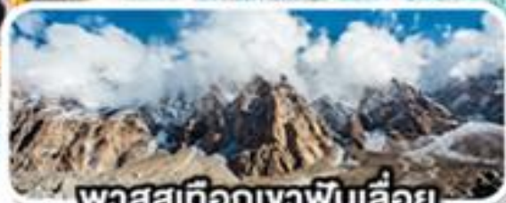
พาสสุเทือกเขาพินเลื่อย

เดินทาง 08-16 ก.พ. 68 (วันวาเลนไทน์, วันมาฆบูชา)