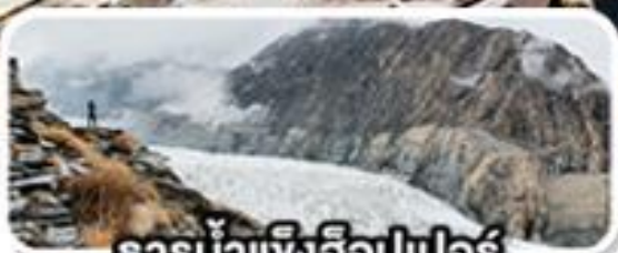
ธารน้ำแข็งอ็อปเปอร์