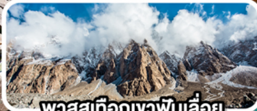
พาสสูเทือกเขาพินเลื่อย

เดินทาง 08-16 ก.พ. 68 (วันวาเลนไทน์, วันมาฆบูชา)