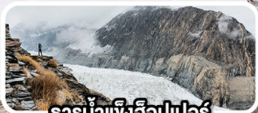
ธารน้ำแข็งอีปเปอร์