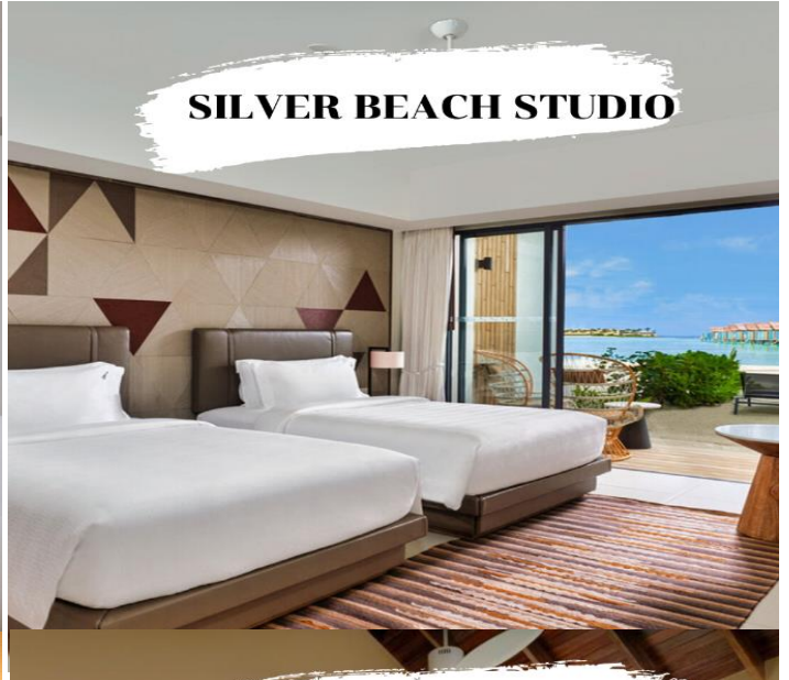
SILVER BEACH STUDIO