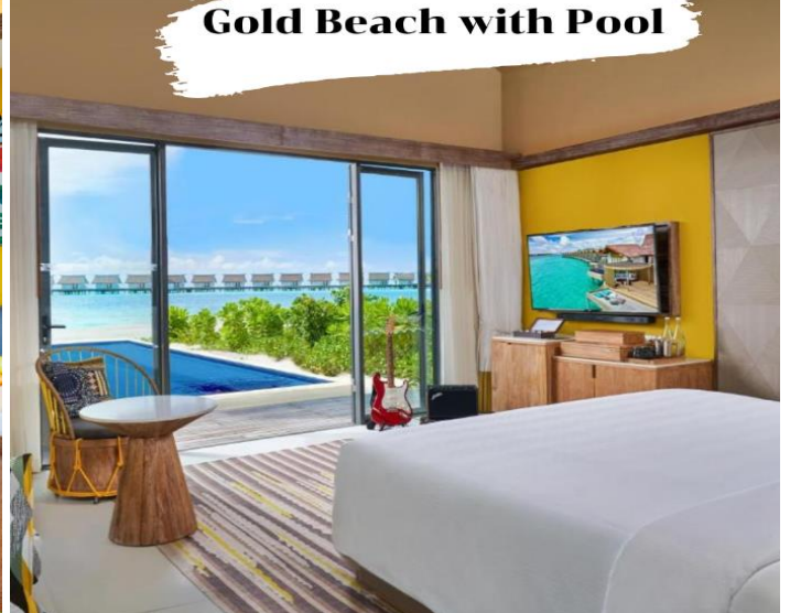
Gold Beach with Pool