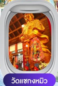
วัดฯชางหมิว