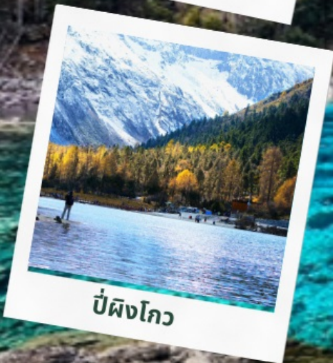
ปี่ผิงโกว