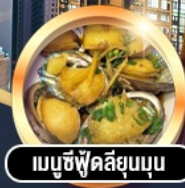
เมนูซีฟู้ดลิ้นมูน