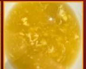
ซุ๊ปข้าวโพด