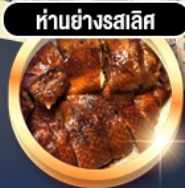
हांอย่างสลิส