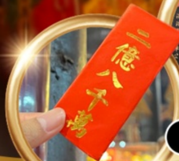
ยืมเงินเจ้าแม่กวนอิม