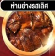
ทำนย่างรสเลิศ