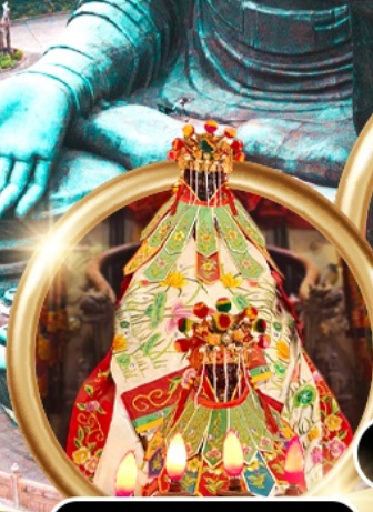
เยี่ยมชมเจ้าแม่กวนอิมสองอำ