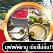
บุฟเฟ่ต์ชาบู เมื่อบริไม้อัน!!