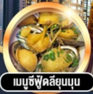
เมนูซุ้คัสสิยมูน