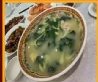
ซุปร้อนใส่หมู