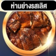
ห่านย่างสไลส