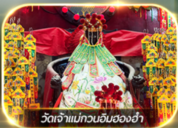
วัดเจ้าแม่ทวนอิมสองอ้า