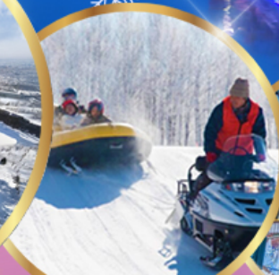
ซิกิไซ สโนว์แลนด์