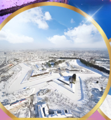
ป้อมโทเรียวคาคุ