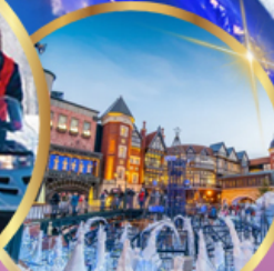
โรงงานช็อคโกแลต ชิโรอิ โคอิมีโตะ