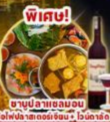
ซาบูปลาหมอลอน หม้อไฟปลาสดอร่อยเข้มข้น + ไวน์ดิลิต