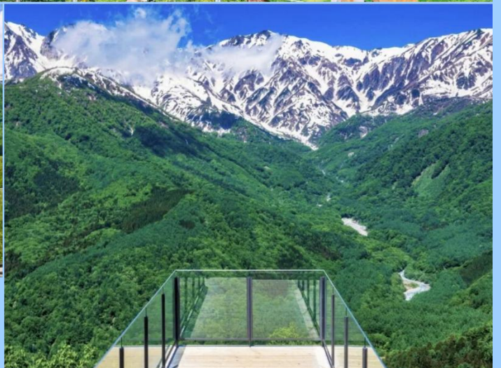
HAKUBA MOUNTAIN HARBOR THE CITY BAKERY