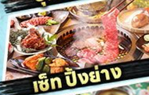
เซ็ท บิงย่าง