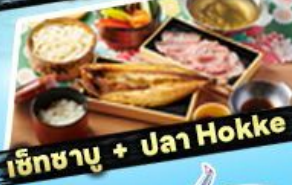
เซ็ทซาซุ + ปลา Hokke