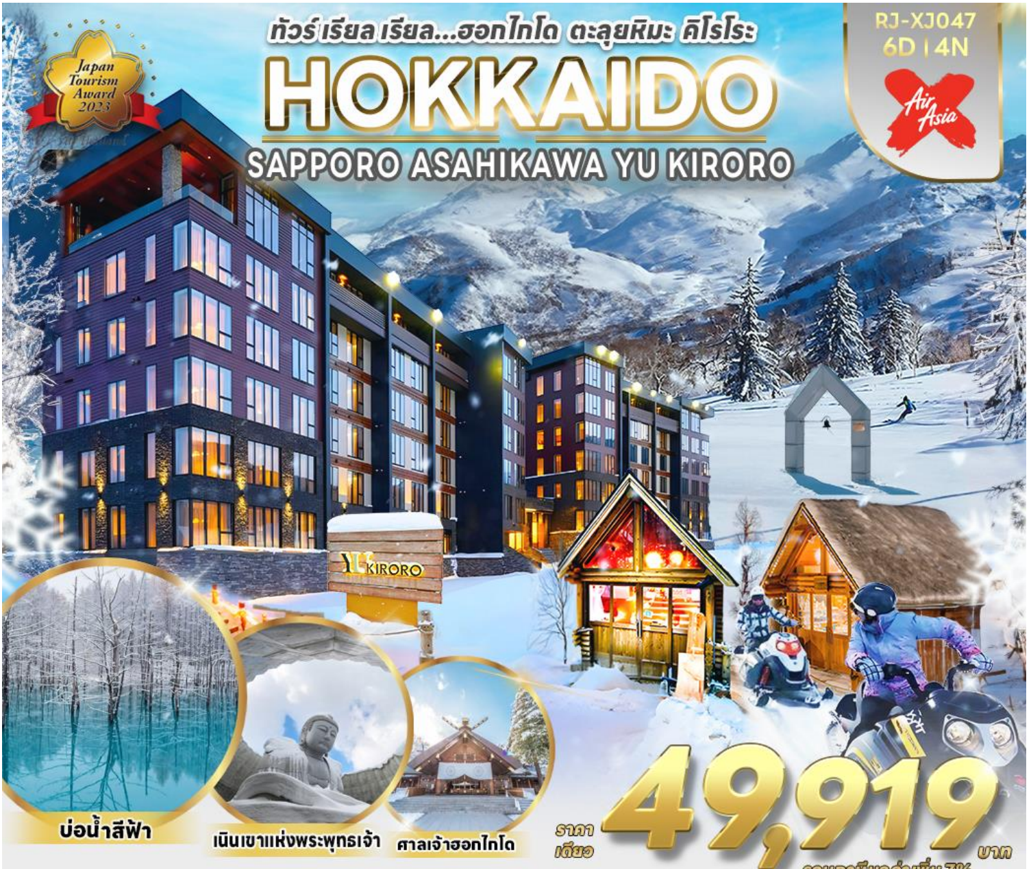
บ่อน้ำสีฟ้า