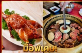
เปิดอย่างฮ่องกง บุฟเฟ่ต์ปิ้งย่างเกาหลี