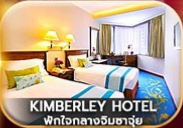
KIMBERLEY HOTEL พักใจกลางอิมฮางุ่ย