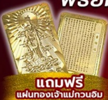
แถมฟรี แผ่นทองเจ้าแม่กวนอิม