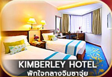
KIMBERLEY HOTEL พักใจกลางจิมซาจ่ย