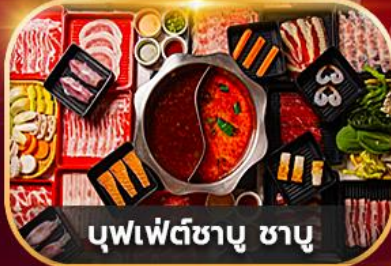
บุฟเฟ่ต์ซาบู่ ซาบู