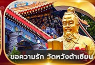
ขอความรัก วัดหวังต้าเซียน