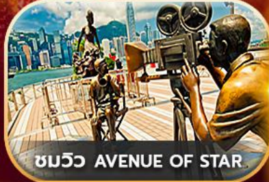
ชมวิว AVENUE OF STAR