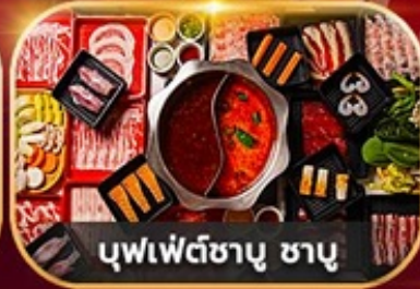
บุฟเฟ่ต์ซาบู ซาบู