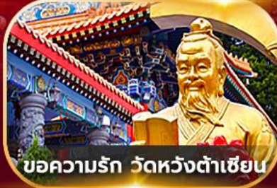
บ่อความรัก วัดหวังต้าเซียน