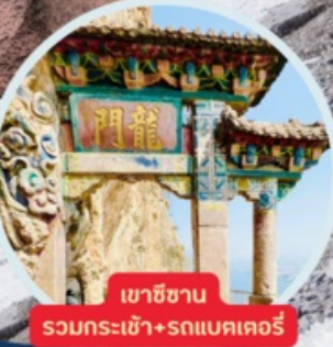
เขาสีซาน รวมกระเช้า+รถแบคเตอร์