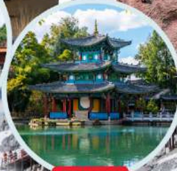
สระมังกรคำ