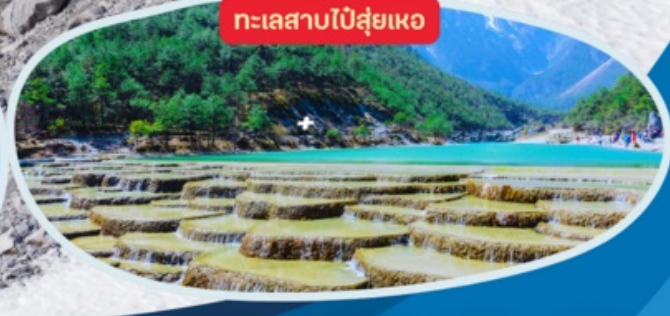
ทะเลสาบไป๋ส่วยเหอ