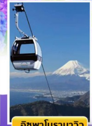
อีซูฟาโนรามาวิว