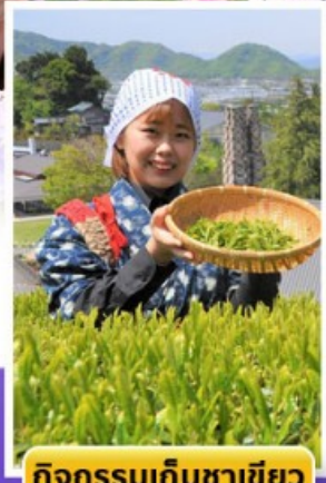
กิจกรรมเก็บชาเขียว