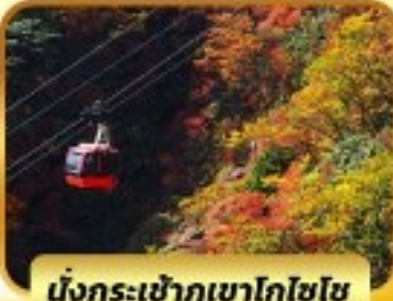
นั่งกระเช้าภูเขาโทโซโซ