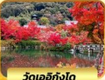
วัดเออิทังโด