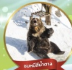
ชมหมีสึน้ำตาล