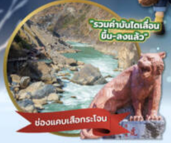
"รวมค่าบินโตเลื่อง บิน-ลงแล้ว"