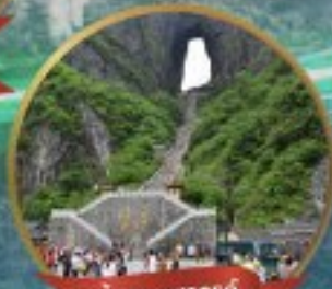
กำแพงมรดกโลก