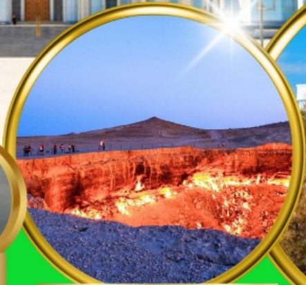
Darvaza Gate To Hell