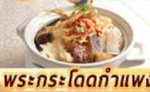
พระกระโดดกำแพง