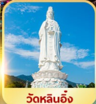
วัดหลินอิ่ง