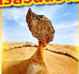
อุทยานหินเหย่หลิว