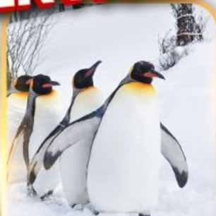
สวนสัตว์อาซาฮิยาม่า