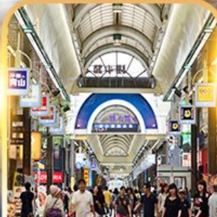
ย่านすすกิโนะ