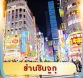
ย่านชินจูกุ