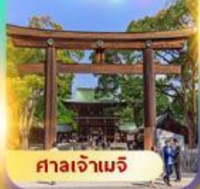
ศาลเจ้าเมจิ