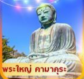
พระใหญ่ คามาคุระ