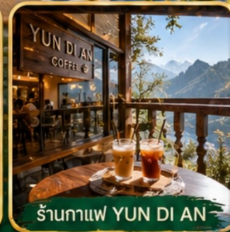
ร้านกาแฟ YUN DI AN