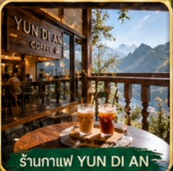
ร้านกาแฟ YUN DI AN