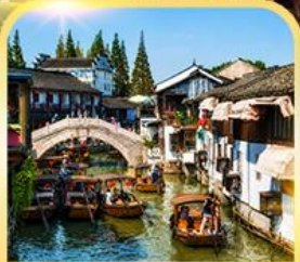
เมืองโบราณซูเจียเจี้ยว