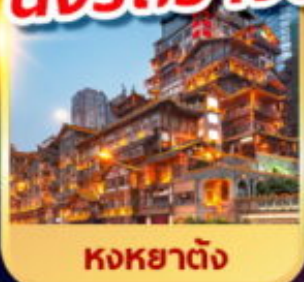
หงหย้าต้ง