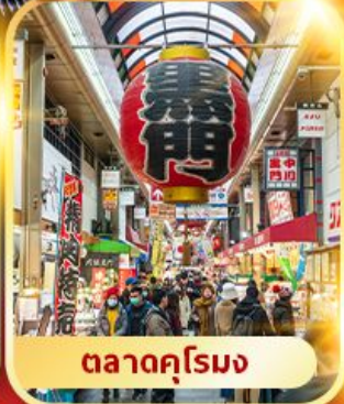
ตลาดคุโรมง