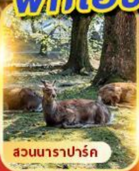
สวนนาราปาร์ค