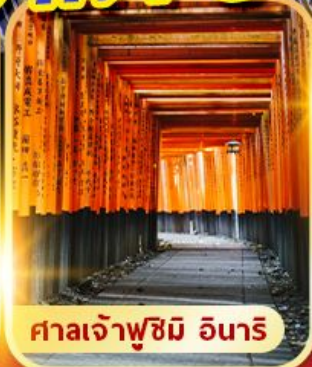
ศาลเจ้าฟูชิมิ อินาริ