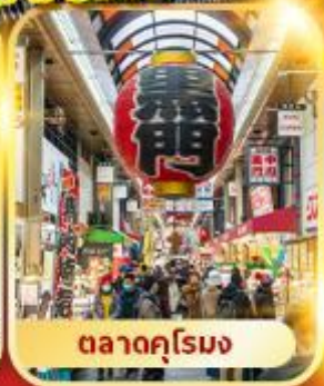
ตลาดคุโรมง