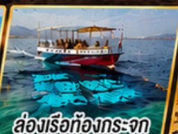
ล่องเรือท้องกระจก