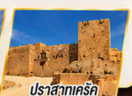
ปราสาทเคร์ค