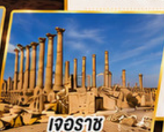
เจอร์ราช