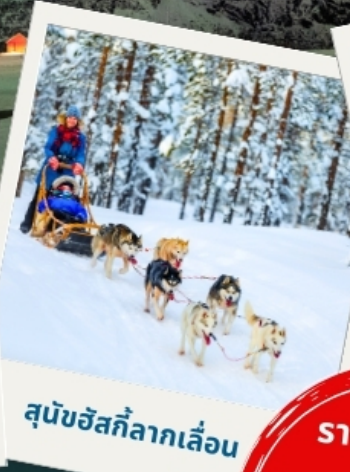
สุนัขฮัสกีลากเลื่อน