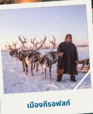
เมืองก็รอฟสค์