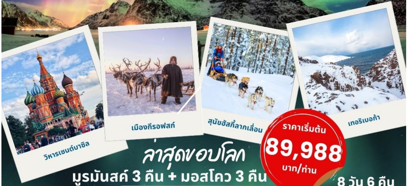
วิหารเซนต์บาซิล

เจาะลึกแสงเหนือ มูร์มันส์ค์ - เทอริเบอก้า - กีรอฟสค์