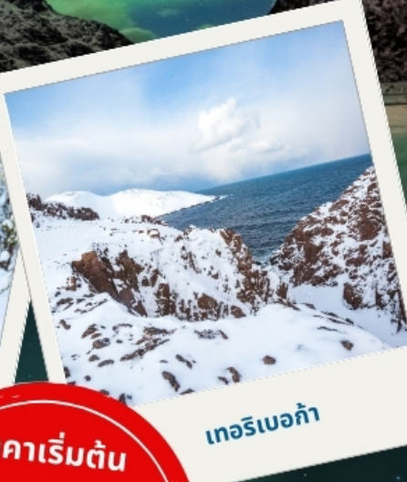
เทอริเบอก้า