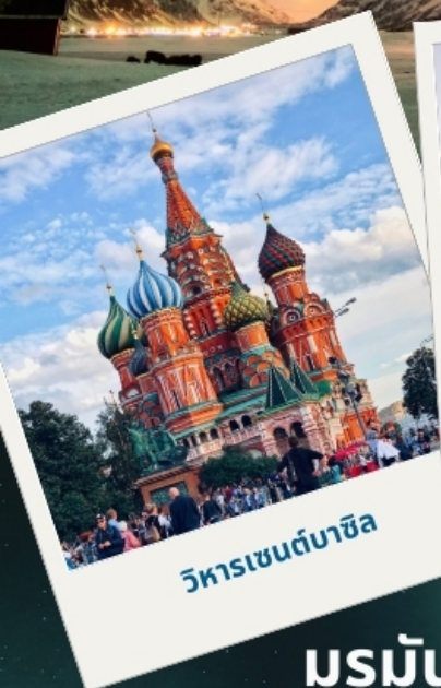
วิหารเซนต์บาซิล

เจาะลึกแสงเหนือ มูร์มันส์ค - เทอริเบอก้า - ก็รอฟสค์