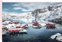
หมู่บ้าน Nusfjord

** พักที่ ELIASSEN RORBUER OR SIMILAR **