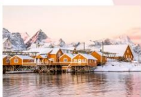
หมู่บ้าน Sakrisoy