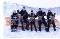
สนุกกับกิจกรรมจับปูยักษ์

00.00 น. ออกเดินทางสู่ เมืองคีร์กเคนส โดยสายการบิน...เที่ยวบินที่... 00.00 น. เดินทางถึงสนามบินเมืองคีร์กเคนส