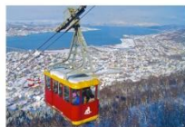
Tromsø Cable Car

** ที่พัก CLARION HOTEL THE EDGE OR SIMILAR **