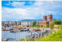
เมืองออสโล

06.10 น. เดินทางถึงนครอิสตันบูล ประเทศตุรกี (แวะเปลี่ยนเครื่อง) 09.00 น. ออกเดินทางสู่กรุงออสโล ประเทศนอร์เวย์ เที่ยวบินที่ TK 1751 11.00 น. เดินทางถึงสนามบินสนามบินเมืองออสโล