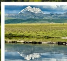
ดวงตาแห่งต่าง

หมู่บ้านทิเบตเจียงจิว • จุดชมวิวกุหลาบหิมะหย่าลา • ป่าหม่มย สวนหินปาหม่ม • จุดชมวิวดวงตาแห่งต่าง • วัดมู่หย่า หมู่บ้านเกออีหรือหม่าซุน • ซินตูเฉียว • หมู่บ้านกุ่มงซุน หมู่บ้านปาหลางเฉิงตู • เมืองลอยฟ้าเกอตีลามู่ • ภูเขาเจ็ดตัวขา ถนนสายรุ้ง • ทะเลสาบแดง • ถนนคนเดินชอยกวางแคบ