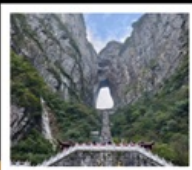
เขากิ๊นเหมินซาน