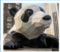
ห้าง IFS แพนด้าป็นตัก