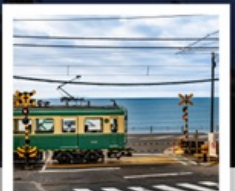
รถไฟเอโนะเด็ตสึ