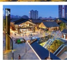
ถนนคนเดินไท่กู่หลี่