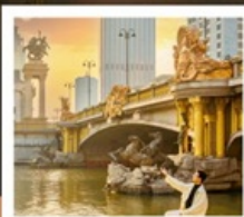
ย่านอิตาลี