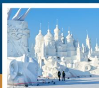
เกาะพระอาทิตย์