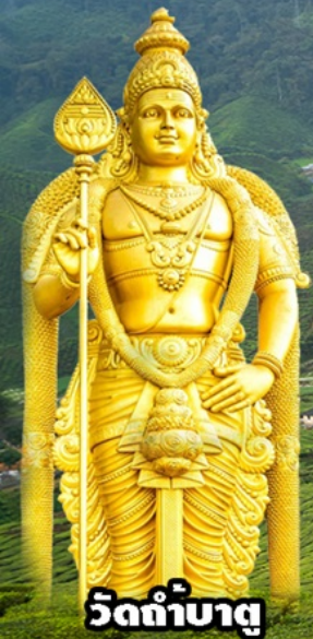
วัดถ้ำบาตุ

ปูตราจายา-คาเมอร์อน-เก็นติ้ง-กัวลาลู 3วัน2 คืน โดยสายการบิน มาเลเซีย แอร์ไลน์ (MH)