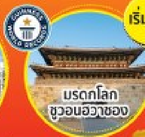
มรดกโลก ชวอนฮวาซอง