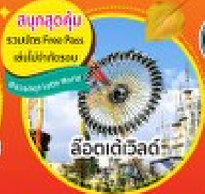
สนุกสุดคุ้ม รวมบัตร Free Pick เล่นไปพักผ่อน