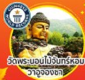
วัดพระบอนไม้จันทร์หอม วาจุงองชกา