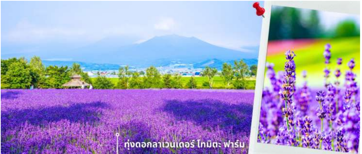
ทุ่งดอกลาเวนเดอร์ โทมิตะ ฟาร์ม

ช่วงเวลาที่ยอดดอกไม้และพืชพันธุ์จะบานสะพรั่งสุดสายตา พร้อมกับบรรยากาศอันสดใสรวมถึงกิจกรรมกลางแจ้งที่ให้น่าเพลิดเพลิน โดยแต่ละช่วงเวลาจะมีดอกไม้ประจำฤดูกาลบานต้อนรับในบรรยากาศสดชื่น และยังมีความสวยงามเป็นเหมือนฉากหลัง ให้น่าได้อิสระเดินชมความสวยงามและเก็บภาพความประทับใจ จากนั้นนำท่านเดินทางสู่ ทุ่งดอกลาเวนเดอร์ โทมิตะ ฟาร์ม ตั้งอยู่ในเมืองฟูราโนะ จังหวัดฮอกไกโด เป็นแหล่งชมทุ่งลาเวนเดอร์ที่มีชื่อเสียงและได้รับความนิยมมากที่สุดแห่งหนึ่งของญี่ปุ่น ในช่วงฤดูร้อน ทุ่งลาเวนเดอร์จะผลิบานเรียงรายเป็นผืนกว้าง สีม่วงสดใสตัดกับท้องฟ้าและธรรมชาติรอบด้าน สร้างทัศนียภาพที่สวยงามและเป็นเอกลักษณ์ ภายในฟาร์มมีการจัดพื้นที่อย่างเป็นระเบียบ ให้น่าสามารถเดินชมดอกไม้ ถ่ายภาพ และเพลิดเพลินกับบรรยากาศ นอกจากนี้ยังมีร้านจำหน่ายผลิตภัณฑ์จากลาเวนเดอร์ เช่น ของที่ระลึก ขนม เครื่องดื่ม ให้น่าได้อิสระตามอัธยาศัย