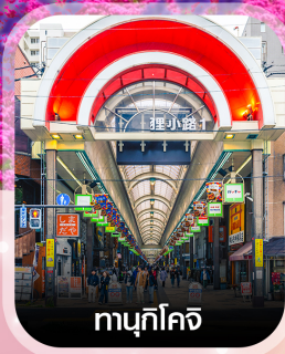
ทามุกิโคจิ

คอนเฟิร์ม ออกเดินทาง ทุกพีเรียด 2 ท่านขึ้นไป