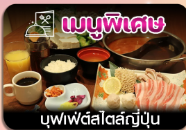
เมนูพิเศษ บุฟเฟ่ต์สไตล์ญี่ปุ่น

ซัปโปโร-ชมทุ่งดอกลาเวนเดอร์-โทมิตะฟาร์ม-ชิชิโนะโอะกะ-น้ำตกชิราอิเกะ-บ่อน้ำสีฟ้า-อีสระะซ็อบบั้งเต็มวัน-ฟักออนเซน