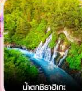
น้ำตกชิราอิเกะ