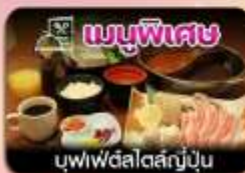
บุฟเฟ่ต์สไตล์ญี่ปุ่น

ชิบโปโร-ชมทุ่งดอกลาเวนเดอร์-โทมิตะฟาร์ม-ซิกิไซโนะโอะกะ-น้ำตกชิราอิเกะ-บ่อน้ำสีฟ้า-อิสระช้อปปิ้งเต็มวัน-พักออนเซน