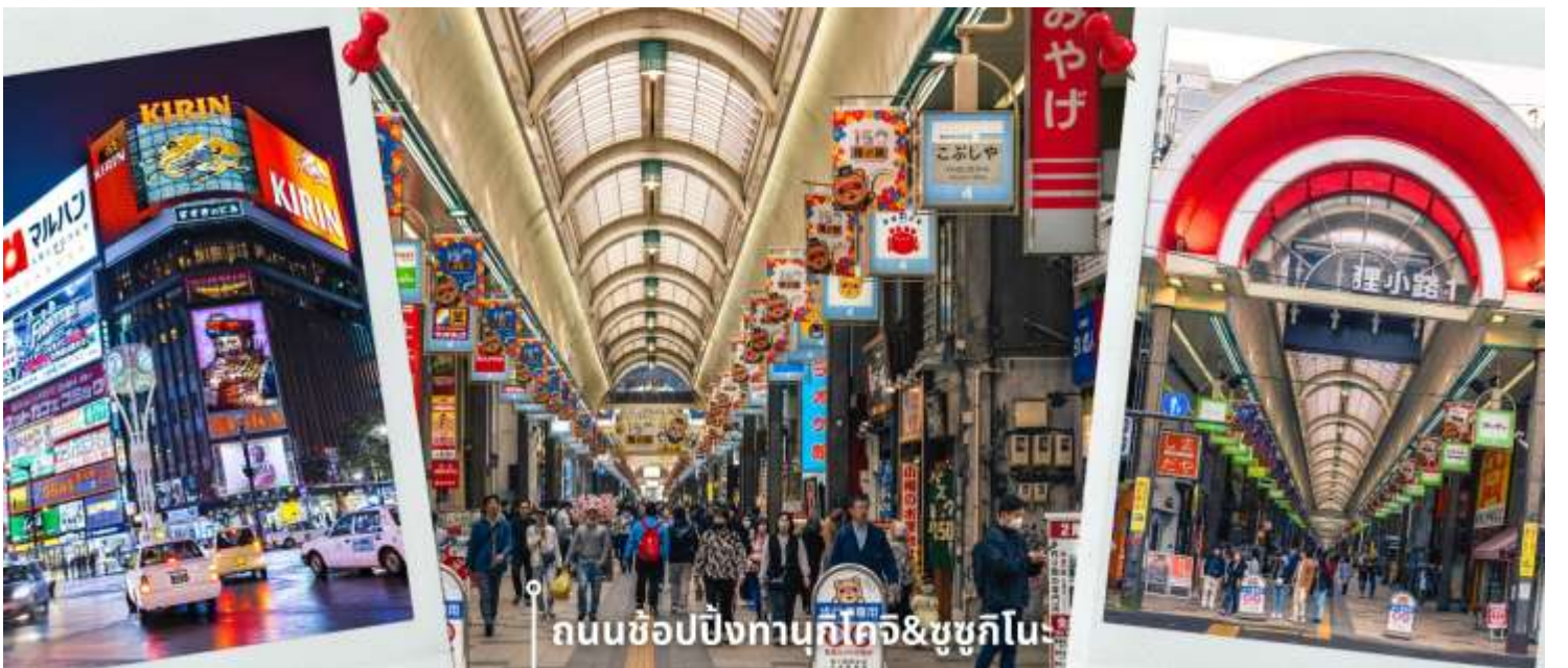
ถนนช้อปปิ้งทานุกิโคจิ&ชูชิกิโนะ

หลังรับประทานอาหารเที่ยง นำท่านเดินทางสู่ DUTY FREE ให้น่าได้ช้อปปิ้งสินค้าปลอดภาษี เครื่องสำอาง ของใช้ ก่อนจะพาท่านเดินทาง ถนนช้อปปิ้งทานุกิโคจิ เป็นถนนช้อปปิ้งที่ตั้งอยู่แทบจะใจกลางเมือง Sapporo โดยมีร้านค้า ร้านอาหาร ห้างสรรพสินค้า ร้านเกม และโรงแรม รวมกันมากกว่า 200 เรียงรายยาวตั้งแต่ทิศตะวันตกยันทิศตะวันออกยาวถึง 1 กิโลเมตร และยังมีบันไดเลื่อนลงไปทางเดินใต้ดินอีกด้วย ซึ่งทางเดินใต้ดินก็ยังมีร้านค้า ร้านอาหารอีกมากมายด้วยเช่นกัน ถนนช้อปปิ้งแห่งนี้เป็นที่ที่หลังจากแทบจะตลอดทาง ดังนั้นแล้วไม่ว่าจะฝนตก