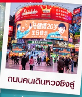
ถนนคนเดินหวงซิงสู