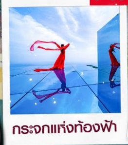
กระจกแห่งท้องฟ้า