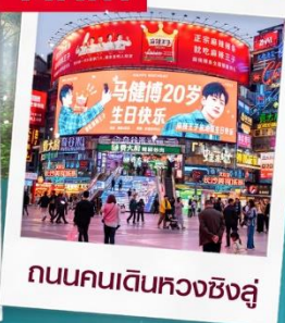
ถนนคนเดินหวงชิ่งลู่